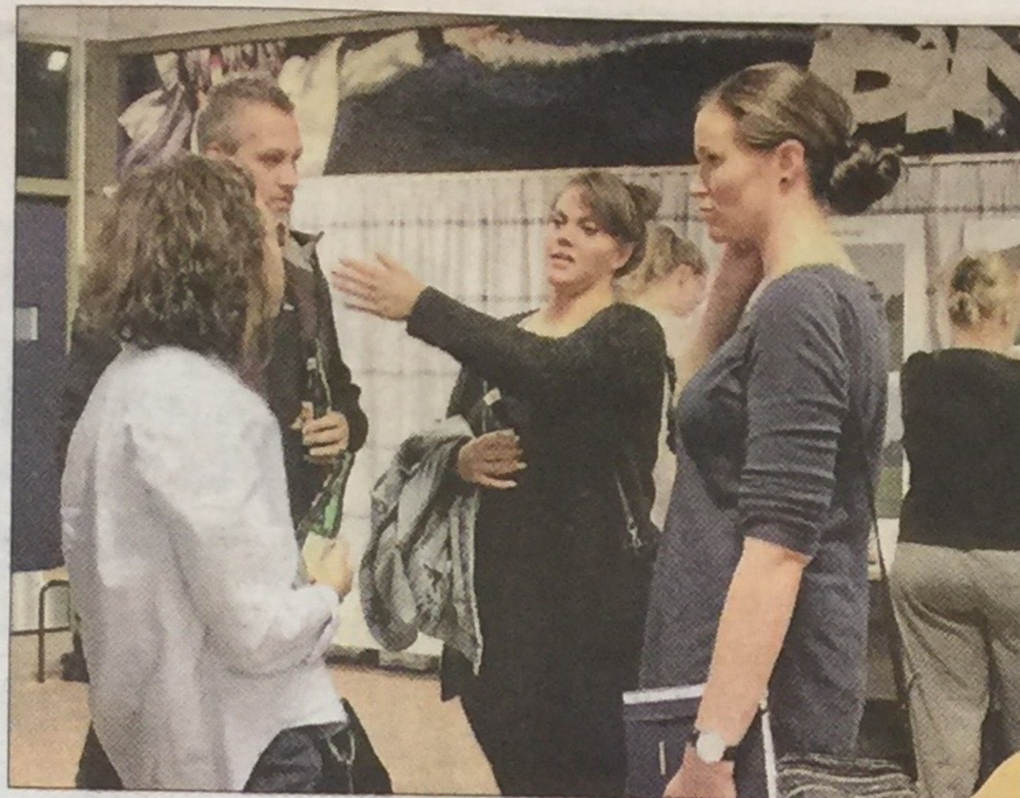
Bekymring blandt nogle af de yngre lokale beboere over planerne for anlægget.