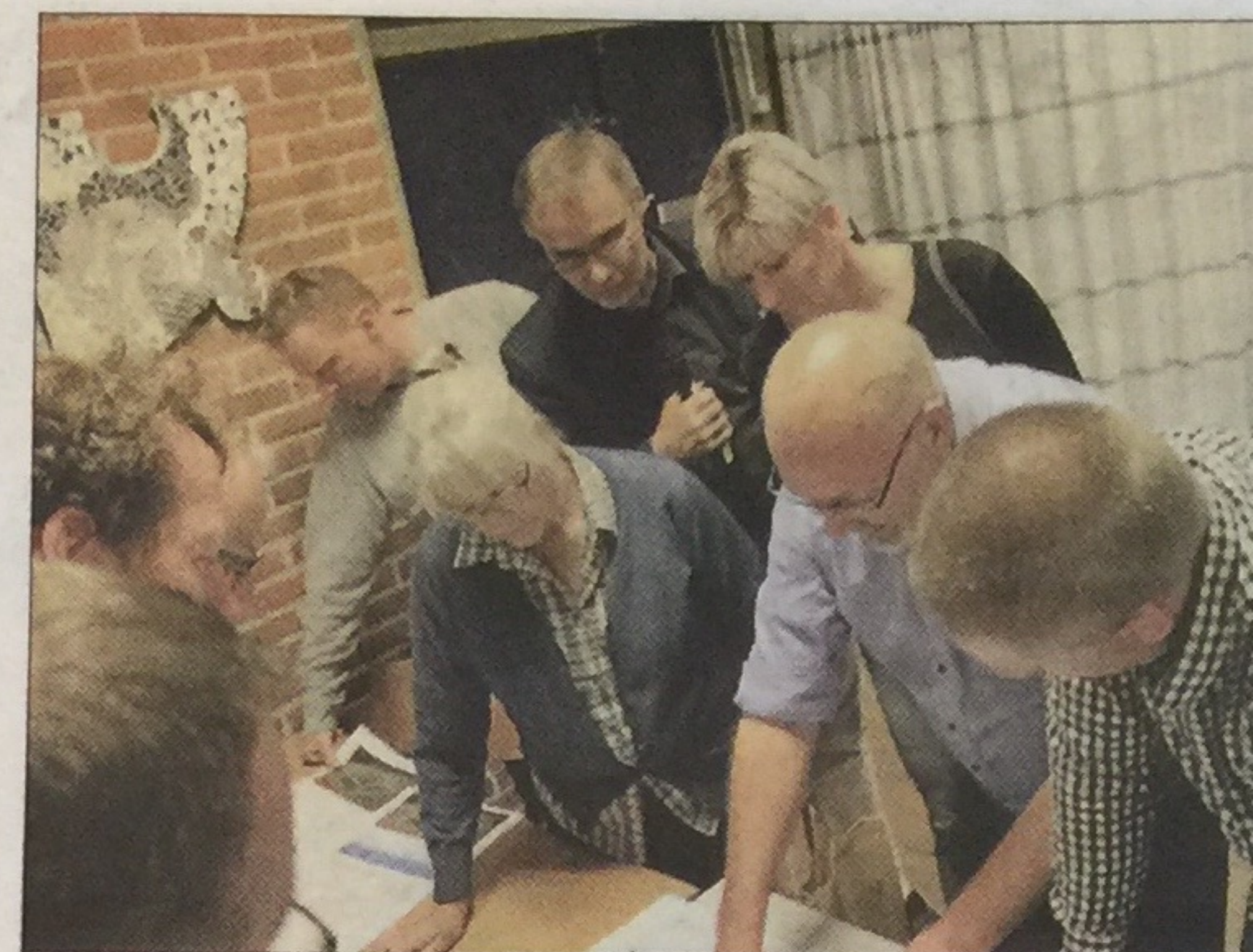
Planerne for biogasanlægget studeres i tre workshops.